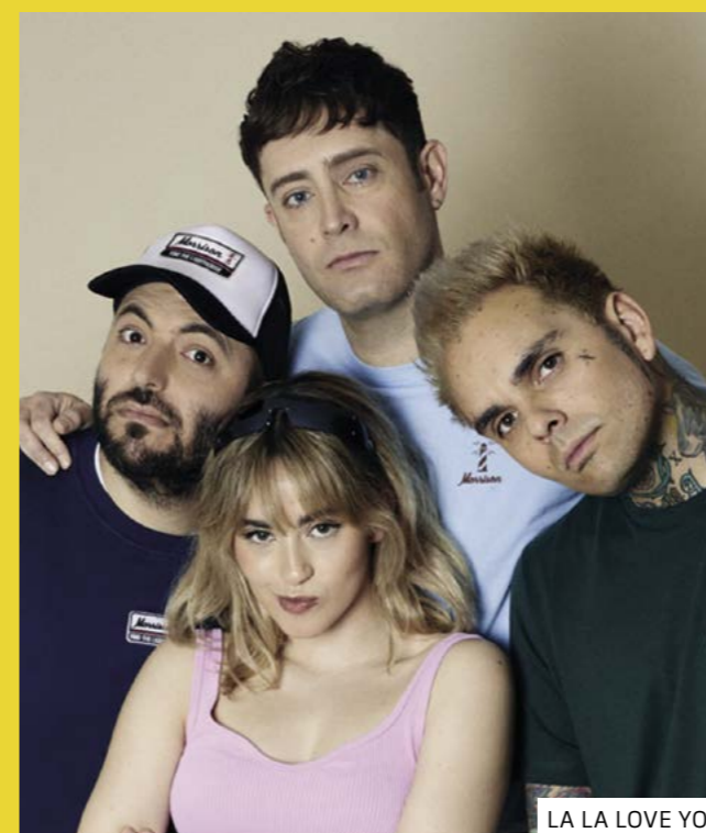
LA LA LOVE YOU